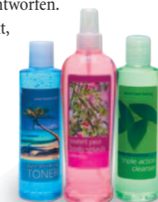
Etiketten für Kosmetikprodukte!

Sie können jede Kombination von Text, Grafiken, Fotos und Abbildungen miteinander verbinden. Jede auf Ihrem Computer installierte Schriftart kann gedruckt werden, was Ihnen maximale Flexibilität und Kreativität bei Ihren Etikettendesigns ermöglicht.