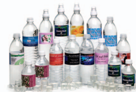
Etiketten für Wasserflaschen!

Der LX810 druckt auf viele verschiedene Materialien einschließlich hochglänzende, matte und seidenmatten Etiketten. Sie können auch Aufkleber, Kunststoffe, Endlospapier, transparentes Polyester und leicht klebbares Material bedrucken. Es gibt sogar Hochglanzetiketten, die hochgradig wasserresistent sind. Sie sind perfekt für Etiketten auf Kisten/Kartons, die Wasser, Regen oder Schnee ausgesetzt werden.