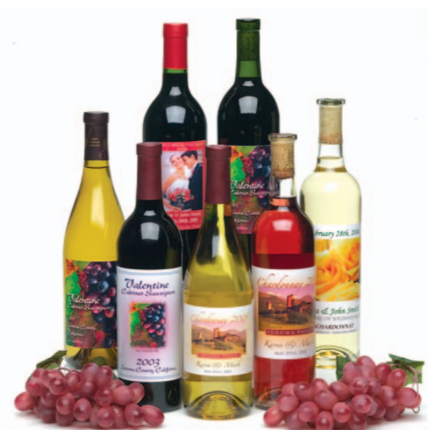
Etiketten für Weinflaschen!

Mit dem LX810 produzieren Sie qualitativ hochwertige, professionelle Etiketten für alle Produkte, die spezielle Kleinauflagen erfordern. Der LX810 ist außerdem hervorragend für den Einsatz als Proof-Drucker für spätere Großauflagen geeignet, nicht zu vergessen Verpackungsetiketten mit Bar-Codes, private Etiketten und den Einsatz bei Werbekampagnen.